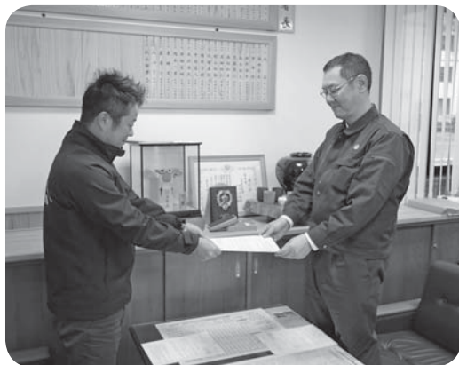
要求書を提出する穴井分会委員長