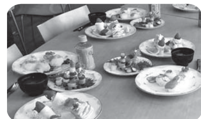
燃える男の料理です