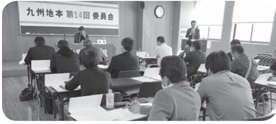
全分会から19名の地本委員が参加

冒頭、甲斐地本委員長は、現在の政治情勢等にふれながら、①「次期、衆議院議員選挙では、全体的に既成政党・政治への不信感やしらせが蔓延する中で、労働組合の政治闘争の必要性や、選挙闘争への組合員の参画状況