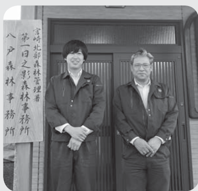
穴山さん（右）と筆者（左）