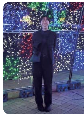
イルミネーションの中の一山さん

最後に、コロナ禍ではありませんが、組合の皆様にとつて幸多き一年となりますようお祈り致します。