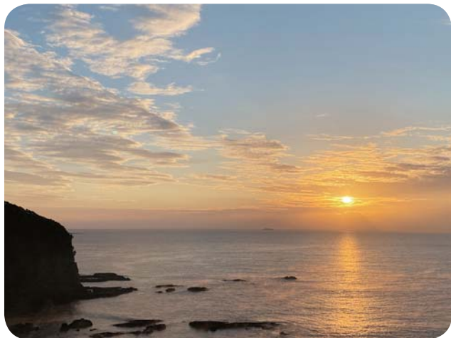
南郷の朝

いて課題が明らかになってい 国が責任をもって、市町村の森林環境譲与税の取組事例の公表や適切な使途が図れるよう、必要な対策を求め、引き続き、取組を進める必要があります。 国有林野事業については、公益重視の管理経営の推進を軸に、国有林と国有林の連携など、国有林の使命・役割は多様化しています。また、「樹木採取権制度」については、その運用のあり方によっては、国有林野事業や地域への影響も懸念されます。 今後においても国内最大の林業の技術者集団として、そこで組織された労働組合として、責任を持って慎重に対策を講じていく考えです。 さらに、毎年定員削減が行われている職場は、空席ポストが増加しており、今後の事業量の推移と退職者数を見ても、マンパワーと業務運営のあり方の議論は避けて通れない状況になっています。