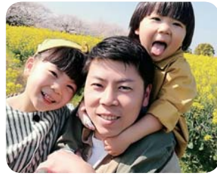
可愛い我が子たちと