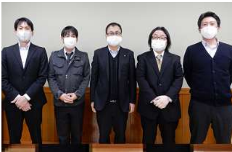
普段はしっかりマスクをしています！