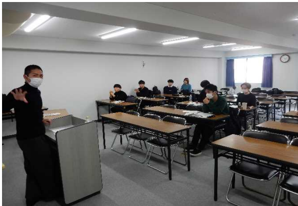
北山青年女性委員長の説明の様子