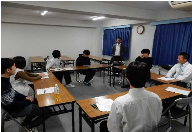
(上) オリエンテーションの様子