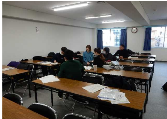
グループ討議の様子