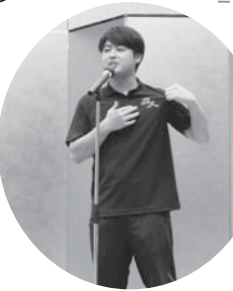
物販Tシャツを紹介！！