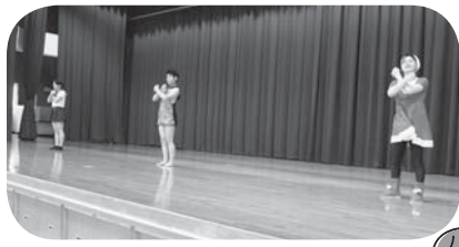
青年女性委員会による体操