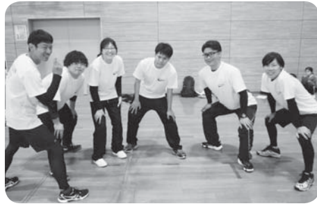
お揃いのユニフォームで！！