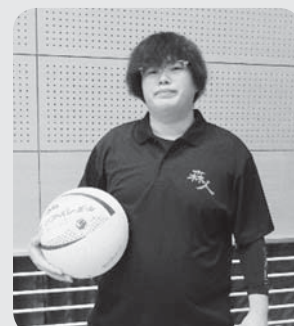
ミニバレーブームを巻き起こす

くすなど少しせつちかでお茶目な一面もありますが、とても明るい性格で周囲からは「梅ちゃん」や「梅太郎」と呼ばれ