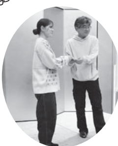
見事に賞品をゲット