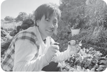
来年はもっと収穫を！

【鹿児島分会・西上通信員】 若手メンバー中心の8名で、ろうきん推進委員会（鹿児島・日置・指宿・鹿児島県庁支店）