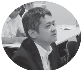
平松（熊本ブロック）