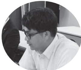
和田（宮崎ブロック）