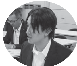
東（鹿児島ブロック）

また、各ブロック代表者からも、現場実態を踏まえた意見を要求しました。これに対し人事院から回答が