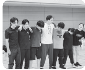
これからも肩を組み仲間を一人にしない

今後も「仲間を一人にしない」を柱に集まる場を確保し、青年女性委員らしい活動ができるよう団結して取り組んでいきます。