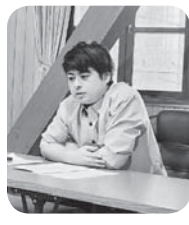
九州の活動を紹介する山形青年女性委員長

本集會に参加し、他の地本の青年女性委員と様々な話をする事ができました。その後4グループに分かれて分散会を行いました。