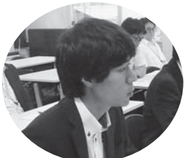
三國（北部ブロック）

あり、「今後も引き続き意見を踏まえて検討していきたい。要求は本院へ伝える」等の回答がありました。要求内容を確実に本院へ伝えることを確認して交渉を終りました。