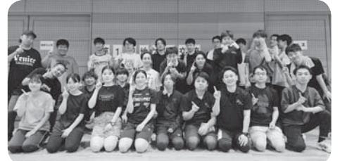
遠くの地でそれぞれ活動している仲間が一枚岩に！

10月19日から20日に広島市において、「第1回地本間交流集会」が開催されました。今回の取り組みは、近中地本、四国地本、九州地本の青年女性委員会が協力し、職場実態をはじめとする様々な悩みや不安などを意見交換し、他の地本と情報共有等することで視野を広げ今後の組合活動に繋げていくことを目的に開催されました。